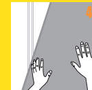
4. Colocar fachada ligera o panel