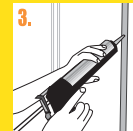
3. Aplicar adhesivo FIX PANELES