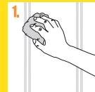
1. Limpieza de superficie